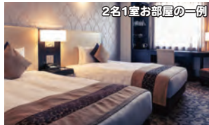
2名1室お部屋の一例